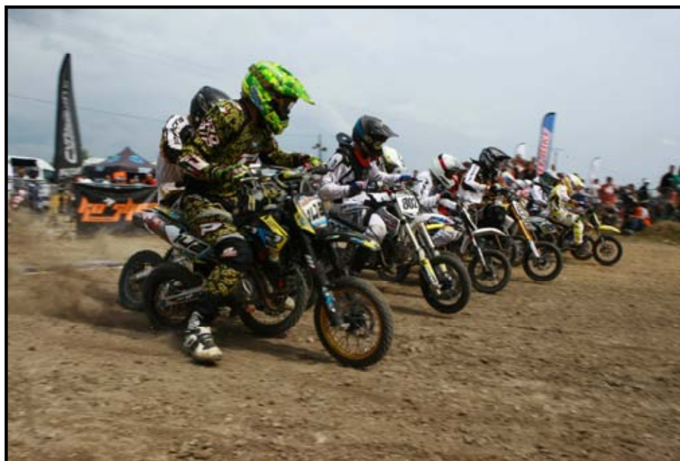
Départ 12 Pro

Cette troisième étape du championnat de France Pit bike s'est déroulée dans l'Yonne, dans la ville de Sens. L'équipe du moto club Sx 89 ont accueilli pilotes, spectateurs et l'équipe de Cyril Porte Concept pour un weekend 100 % Pit bike. Une piste typé Sx a été retracé pour l'occasion. Très technique, le terrain a ravi les quelques 200 riders présents sur le circuit. La météo a été une fois de plus assez maussade le samedi avec quelques averses pour laisser place à de belles éclaircies le dimanche.